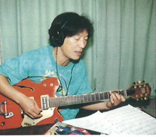
Dannyさんの曲作りもラストパート